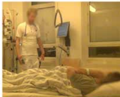
Billede F: 08:06:50 L11, L: og dine ben er også [hævet op