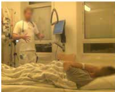
Billede E: 08:04:00 L11, L: har haft tiltagende maveomfang