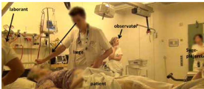
FIGUR 1: OVERBLIK OVER SITUATIONEN

I nærværende eksempel er en ældre dame netop ankommet med 112. Hun bløder rektalt, og hendes situation er akut og uafklaret: Blødningen fortsætter, hvilket er et alvorligt symptom, og ingen ved, hvorfor hun bløder. Til stede er en laborant, en sygeplejerske, en læge, en observatør og patienten. Lægen indleder en dialog med patienten for at få informationer, der kan lede til en tentativ diagnose. Hurtigt bliver han forstyrret af forskellige typer af afbrydelser. Nedenfor præsenteres et øjebliksbillede af situationen.