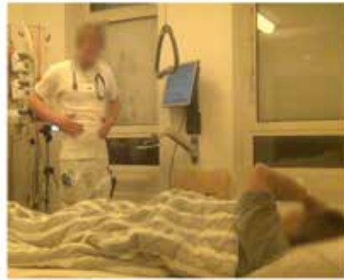
Billede H: 08:20:20 I.18, L: du har ikke sådan decideret mavesmerter