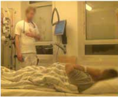
Billede G: 08:08:50 I.13, L: lidt værre med din ændenød