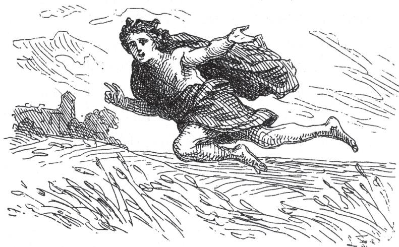
FIGUR 2. LORENZ FRÖLICH: VINDEN SOM FORTÆLLEREN I H.C. ANDERSENS HISTORIE (CA. 1870)

Folkeeventyret indeholder også tankegengivelse såvel som direkte og indirekte replikgengivelse. Og i modsætning til de tre øvrige markeres status som fiktionsfortælling tydeligt fra starten, omend ikke med den klassiske formel: “Der var en gang en konge der havde tre sønner.” Men med noget der betyder det samme. Og da kongen åbner munden for at henvende sig til sine sønner, er det med en kombination af en ordre og et løfte. Sønerne skal drage ud i verden for at finde en ny kæde til hegnet om slottet. De skal vende tilbage senest efter et år. Og den der finder den længste kæde, får løfte på at blive den nye konge.