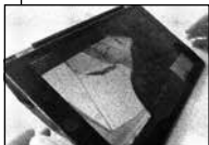
FIGUR 4.8 A ER DELVIS I B'S SYNSFELT.