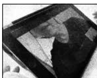
FIGUR 4.14 A FASTHOLDER BLIK OG KROP.