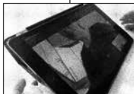
FIGUR 4.9 A BEVÆGER SIG HEN MOD KAMERA.