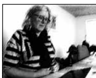
FIGUR 4.21 A FOLDER HÆNDER PÅ KANTEN AF BORDET