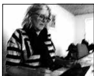
FIGUR 4.20 A FJERNER HÆNDER FRA IPAD