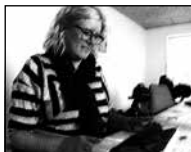
FIGUR 4.12 B FASTHOLDER BLIK OG KROP.

12 B: jeg ka- jeg ka kun se din overkrop