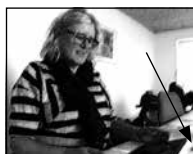
FIGUR 4.6 B RYKKER KROPPEN LIDT FREM OG KIG- GER I SKÆRMEN.