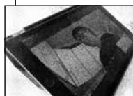
FIGUR 4.19 A DREJER KROP MOD KØKKENVASK