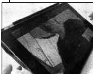
FIGUR 4.11 A FASTHOLDER KROP TÆT PÅ KAMERA.