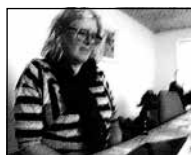
FIGUR 4.22 AS HÆNDER ER UNDER BORDET