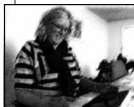
FIGUR 4.4 B KIGGER SMILENDE NED I SKÆRMEN. KROP I RET VINKEL TIL BORDET.