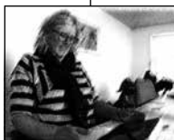
FIGUR 4.5 B RYKKER KROPPEN TILBAGE OG FAST- HOLDER SIT SMIL.