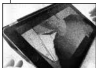
FIGUR 4.15A A TAGER SKRIDT BAGLÆNS

14 A: men det fordi jeg står å vasker op