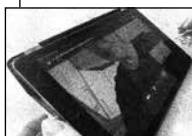
FIGUR 4.1 A'S KROP OG ANSIGT ER VENDT MOD SKÆRMEN.