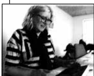
FIGUR 4.13 B FASTHOLDER BLIK OG KROP.

12 B: jeg ka- jeg ka kun se din overkrop