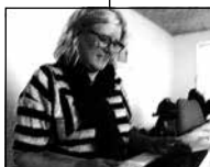
FIGUR 4.10 B FASTHOLDER BLIK OG KROP OG SMILER.