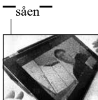
FIGUR 4.16 A POSITIONERER SIN KROP FORAN KAME- RAET.