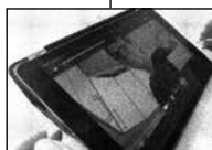
FIGUR 4.2 A TRÆDER TILBAGE SÅ HENDES ANSIGT ER SYNLIGT FOR B, OG SMILER.