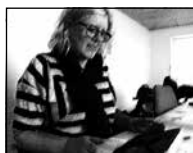
FIGUR 4.7 B LÆNER SIG LÆN- GERE FREM MOD SKÆRMEN. BLIK FASTHOLDES.