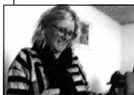
FIGUR 4.3 B SMILER NED TIL SKÆRMEN.